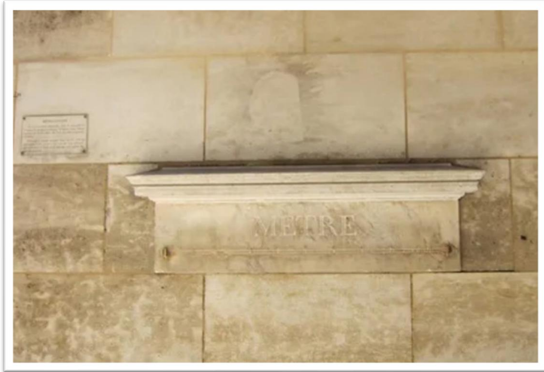
Figuur 2 De standaard meter in Parijs

Standaardisatie: Invoering van het metrieke stelsel (meters, liters, kilo's) en de verplichting een achternaam aan te nemen als je die nog niet had. De standaard meter berust in Parijs.