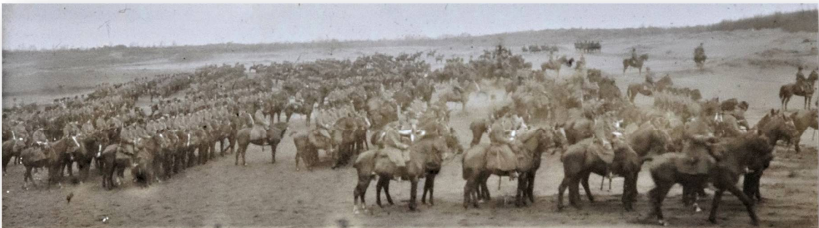
Foto 2 Manoeuvres in N.O-Brabant in 1910

Zeeland, 10 sept 1910: was aanvankelijk bepaald dat we in ons dorp slechts drie dagen inkwartiering zouden krijgen thans vernemen we dat we zes dagen de blauwe huzaren in ons midden zullen hebben en wel van 8 tot en met 13 september. Vanwege de manoeuvres hier en in den omtrek zal onze processie dit jaar niet op 8 september naar Uden trekken, doch op een andere, nader te bepalen dag.