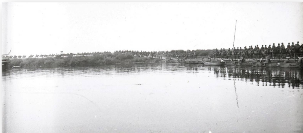
Foto 3 Cavaleristen trekken de Maas over via een pontonbrug

17 september Veghel: De militairen die 17 dagen in ons dorp een eigenaardige drukte teweegbrachten zijn weer vertrokken. Donderdagmorgen vervoerden een paar extra treinen de manschappen en paarden naar hun garnizoen. Dikwijls hebben we kunnen genieten van heerlijke muziek. De neringdoenden hebben een goede cent verdiend, zodat velen het vertrek der huzaren betreuren.