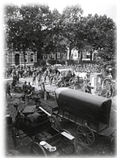
Foto 1 Cavaleristen op doortocht in 1910 in het centrum van Nistelrode

Grave, 3 september 1910: Ons wordt bericht dat de eskadrons huzaren morgen, zaterdag tussen 12 en 13.30 uur het pontveer zullen overtrekken. De officieren welke gedurende de manoeuvres in onze omgeving, in Grave, Velp en Escharen worden gedetacheerd zullen hun intrek nemen in het alom bekende hotel De poort van Cleef alhier.